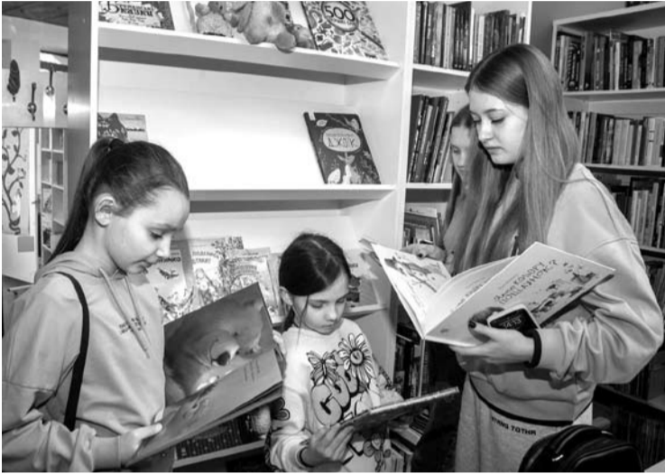
Anykščių L. ir S. Didžiulių viešojoje bibliotekoje ukrainiečių kalba parašytų knygų ateina skaityti ir jaunieji ukrainiečiai, šiuo metu gyvenantys Anykščiuose.