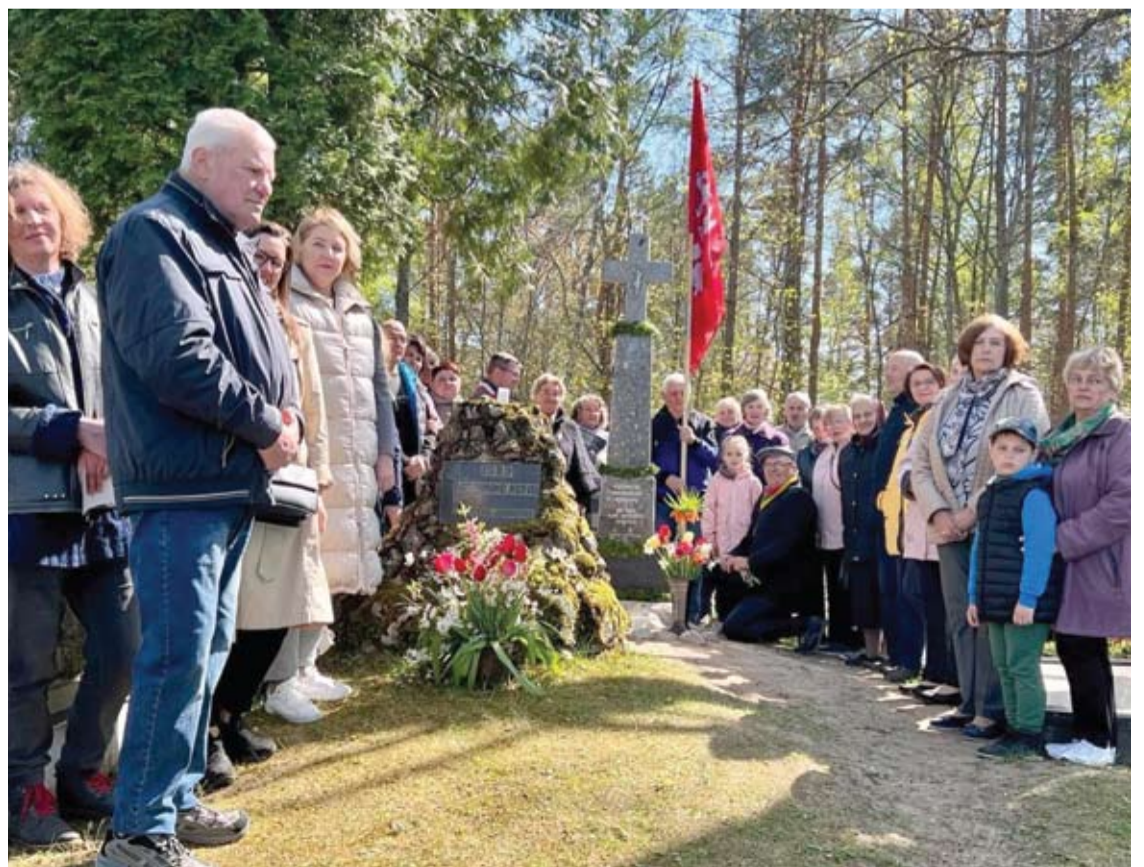
Į kryžiaus šventinimo iškilmes susirinko didelis būrys butėniečių ir svečių.

Butėnų bendruomenės namų seklyčioje vaišintasi arbata, kava, kaimišku sūriu, pyragais, saldėsiais, aptarti sodžiaus reikalai. Didis rūpestis – atstatyti Šv. Jono Krikštytojo stogastulpį prie Naručio upelio, artėjančių Joninių tradicinis šventimas, rugpjūtį įvyksianti tradicinė Butėnų diena, kurios tema dar nepaskelbta. Apžiūrėti Lietuvos šimtmečio ąžuolėliai, kvapnis beržas, pasigėrėta žiedus pradedančiomis skleistis senomis, aukštaūgėmis obelėmis, įkopta į aukštą kalną už senojo sodo. Tikriausiai gražiojo Butėnų apylinkių pasaulio regyklą, iš kurios atsiveria į visas puses plytinčios erdvės. Kadaise nuo šios aukštumos net Debeikių bažnyčios bokštai matydavosi, dabar ją užstoja išsistiepe paupio pušynai.